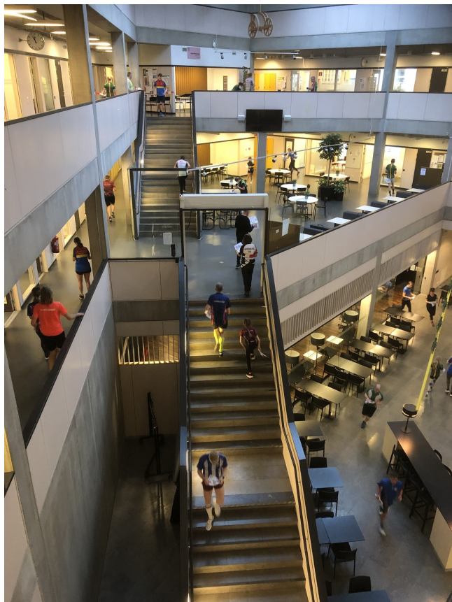
25 löpare på samma bild!

Det bjöds på en etapp före och en efter lunch. Förmiddagens banor var lite enklare än eftermiddagens, då nyligen inlärd terrängkännedom skulle neutraliseras. Klubben hade flera kontrollanter ute i skolan för att bevaka avspärningar och enkelriktade partier samt hålla koll på skolmaterialet i lokalerna och det vittnades om både stark fokusering och ibland förvirring bland löparna.