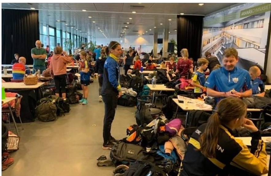
Fullt med folk i matsalen

Vill du se fler bilder så rekommenderas Väst kustens Indoor Cup | Kungsbäckå | Facebook